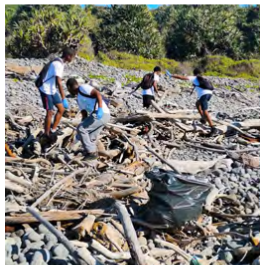
JOURNÉE DE LA TERRE : LES ÉLÈVES DU COLLÈGE GUY MOQUET (BRAS-FUSIL) MOBILISÉS POUR NETTOYER LE LITTORAL • 22 AVRIL 2024