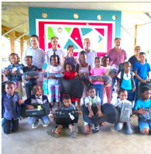
REMISE DES INSTRUMENTS À LA CLASSE ORCHESTRE DE L'ÉCOLE DANIEL HONORÉ