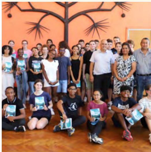
ACCUEIL DES LYCÉENS DANS LE CADRE DE L'ÉCHANGE SCOLAIRE FRANCO-ALLEMAND (LYCÉE JEAN CLAUDE FRUTEAU)