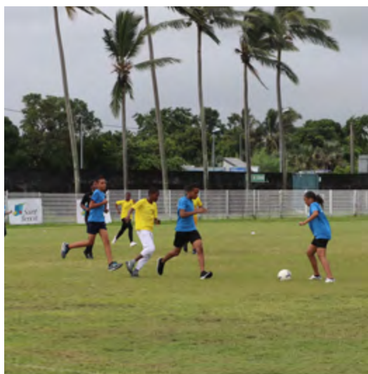
TOURNOI DE FOOTBALL MIXTE INTER-ÉTABLISSEMENT DE L'EST AU STADE JEAN ALLANE