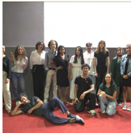
CONCOURS D'ÉLOQUENCE OCÉAN INDIEN