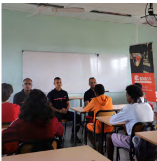
FORUM DES MÉTIERS DU COLLÈGE GUY MOQUET