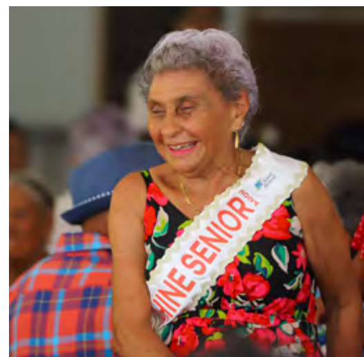
400 SENIORS RÉUNIS POUR LE BAL LA POUSSIÈRE ORGANISÉ PAR LE CCAS • 17 AVRIL 2024 •