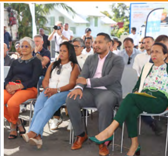
RÉCEPTION DU TRONÇON GHER > ROND-POINT DES PLAINES ET LANCEMENT DES TRAVAUX SUR LA RUE AUGUSTE DE VILLÈLE