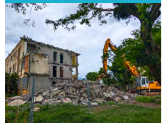
Démolition en cours à Labourdonnais